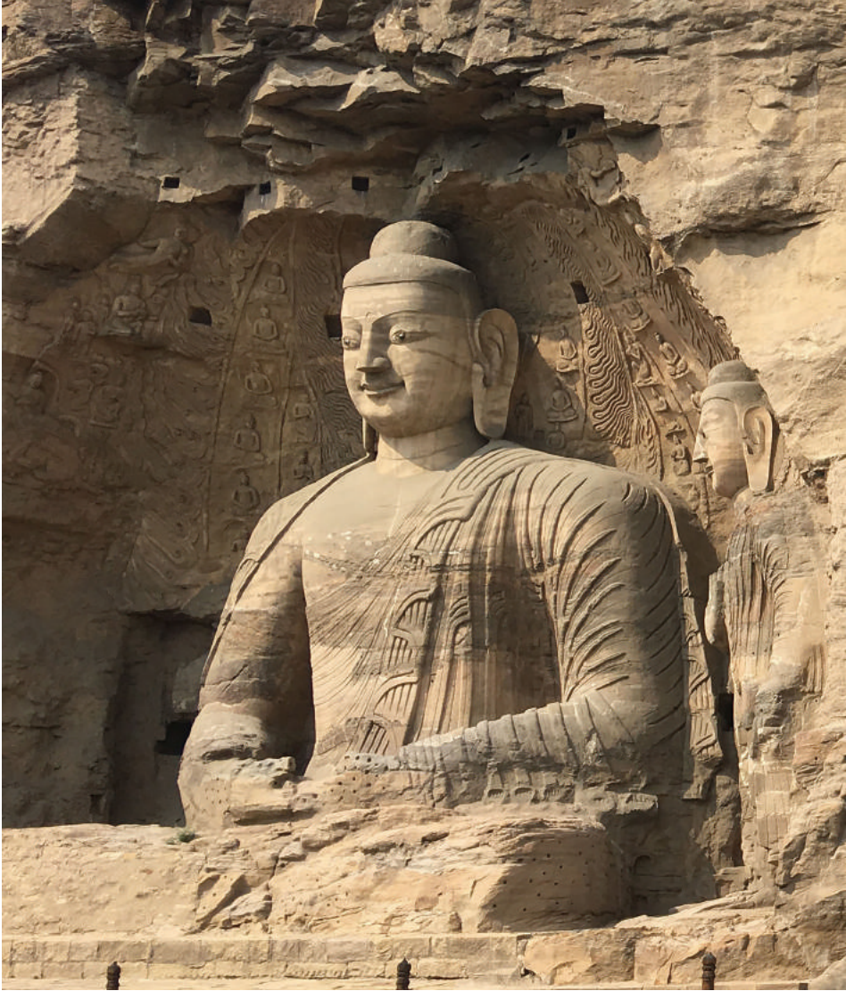
圖 2-1：雲岡第 20 窟主尊