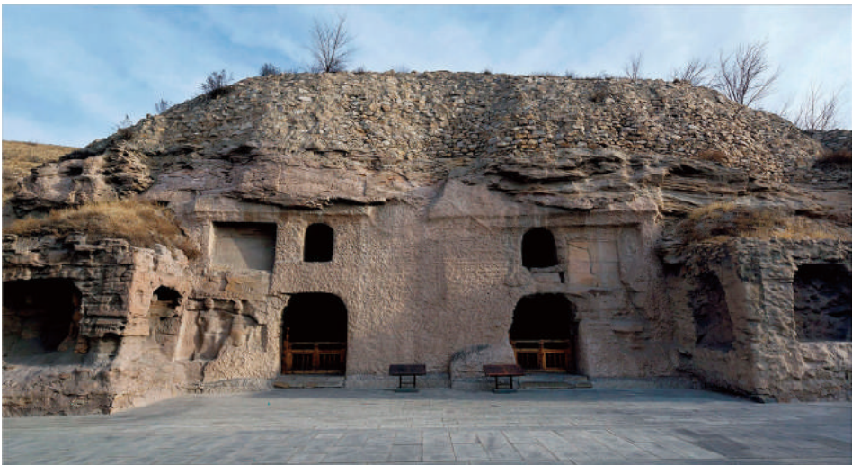
圖 4-2: 雲岡石窟第 1、2 窟