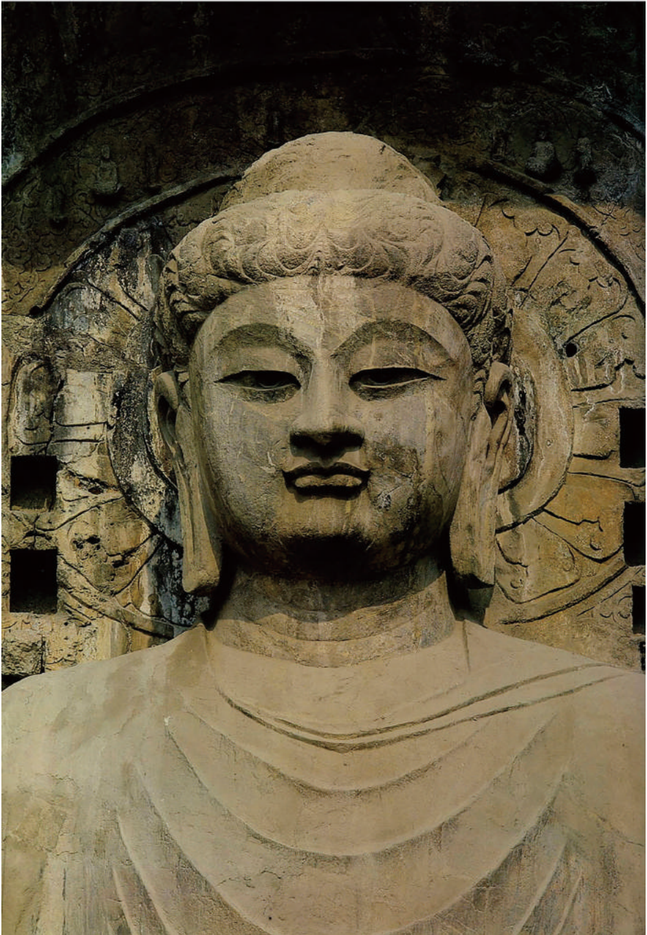
圖 3-2：龍門石窟大盧舍那像龕