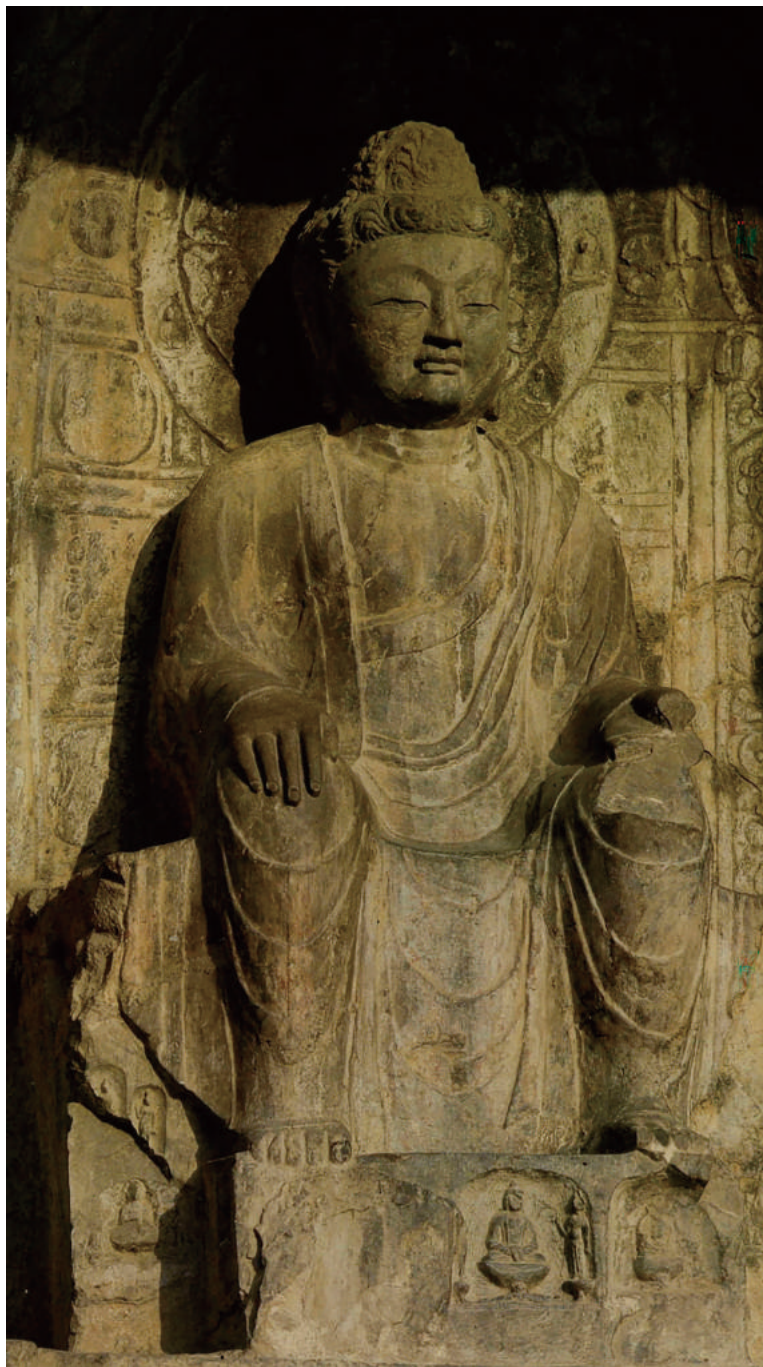
圖 3-1：龍門石窟惠簡洞主尊（採自《中國石窟·龍門石窟》（二）圖版 88）