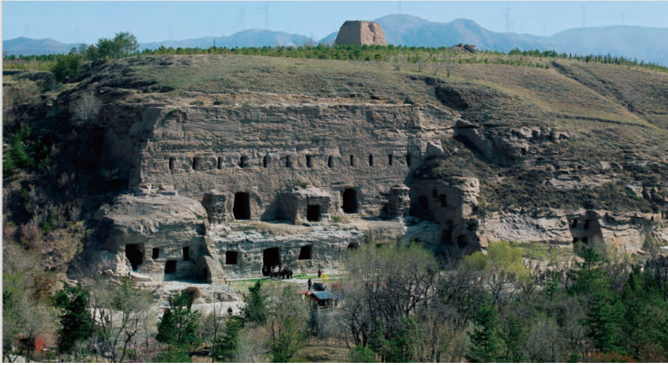
圖 4-1: 雲岡石窟第 3 窟