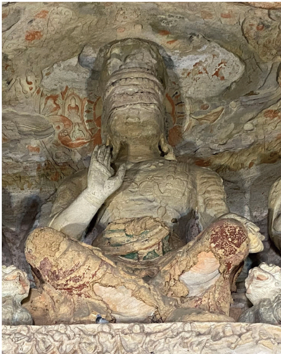
圖 2-2：雲岡第 7 窟後室上層主尊